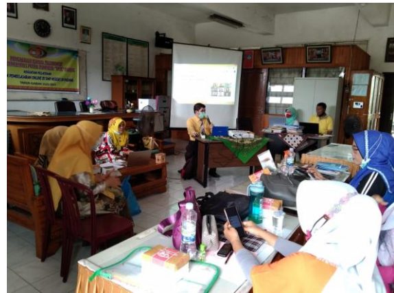
Gambar 2. Penyampaian Materi Pembuatan Google Form