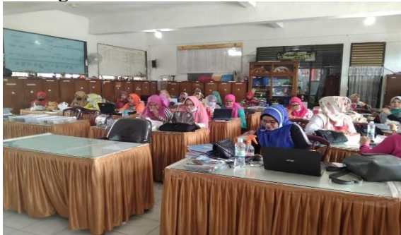
Gambar 1. Penyampaian Materi Pembuatan Google Form

Berikut ini adalah foto dari pelaksanaan PKM yang telah dilakukan di SMPN 30 Padang