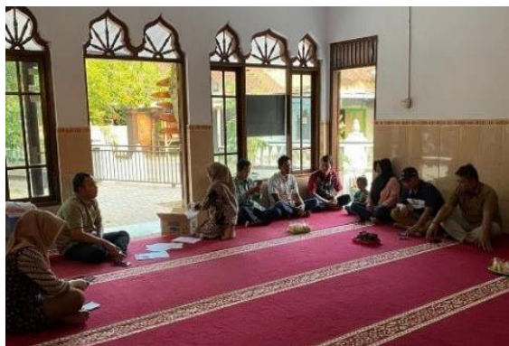
Gambar 3. Rapat Koordinasi dengan Mitra

antara tim pengabdian dengan masyarakat desa begitu penting untuk dilakukan di awal berjalannya program. Tim pengabdian tidak menginginkan akan adanya permasalahan ketika sedang melaksanakan program (Wibowo et al., 2020). Oleh karena itu, rapat koordinasi sekaligus sosialisasi program pengabdian ini begitu penting untuk dilaksanakan