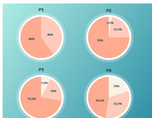
Gambar 5. Hasil Kuesioner Pertanyaan 1 sampai 4 Tentang Materi Pengabdian

Berdasarkan jawaban hasil kuesioner tingkat kepuasan masyarakat terhadap program pengabdian kepada masyarakat, maka langkah selanjutnya adalah menentukan Indeks Kepuasan Masyarakat (IKM). IKM merupakan sebuah upaya yang dilakukan oleh seorang peneliti untuk mengetahui tingkat kepuasan masyarakat terhadap sebuah fenomena tertentu (Damayanti et al., 2019).