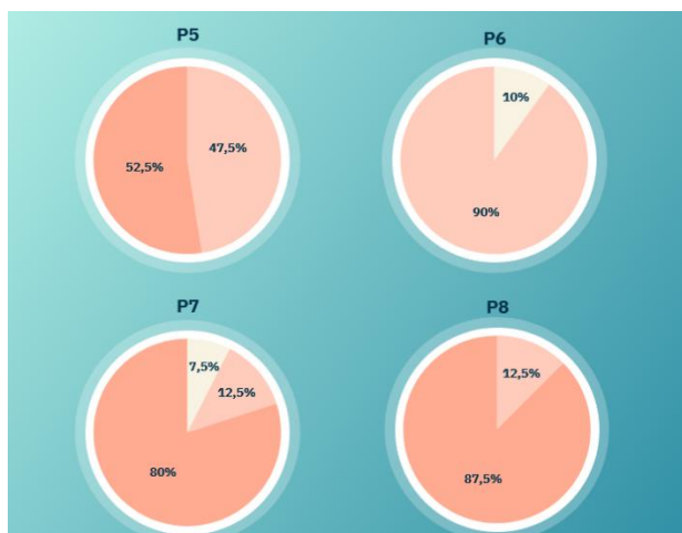
Gambar 6. Hasil Kuesioner Pertanyaan 5 sampai 8 Tentang Tim Pelaksana Pengabdian

menjawab bahwa materi cukup sesuai dengan tema program pengabdian, 22,5% setuju bahwa materi sesuai dengan tema pengabdian, dan 47,5% sisanya sangat setuju bahwa materi yang disampaikan sesuai dengan tema pengabdian. Pada pertanyaan ketiga, 7,5% responden cukup setuju dengan materi yang disampaikan secara runtut, 20% setuju bahwa materi disampaikan secara runtut, dan 72,5% sangat setuju bahwa materi memang disampaikan secara runtut. Pada pertanyaan keempat, 20% responden cukup setuju bahwa metode pengabdian tidak membosankan, 32,5% setuju bahwa metode pengabdian tidak membosankan, dan 47,5% sangat setuju bahwa metode pengabdian memang tidak membosankan.