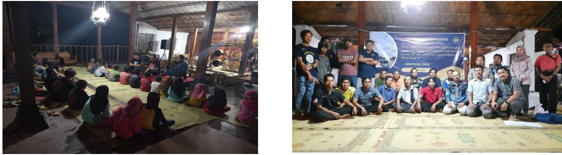
Gambar 4. Pelaksanaan Workshop

Gambar 3 menunjukkan pelaksanaan workshop pola hidup sehat yang diberikan kepada anak-anak generasi muda di desa Krapyak. Workshop ini dilaksanakan terpisah karena mempertimbangkan karakteristik anak-anak yang harus diedukasi dengan cara yang sesuai dengan tingkatan umur mereka. Karena tidak mungkin seorang anak-anak akan diajar sebagaimana cara mengajar orang dewasa (Wahono et al., 2020). Oleh karena itu, workshop pembinaan pola hidup sehat ini dilakukan secara terpisah untuk memaksimalkan penyampaian materi yang ingin disampaikan.