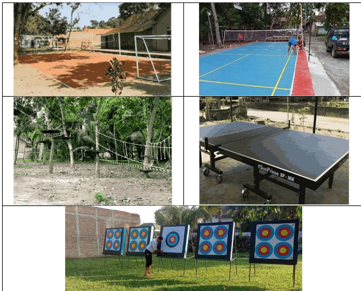
Gambar 2. Sarana dan Prasarana Olahraga